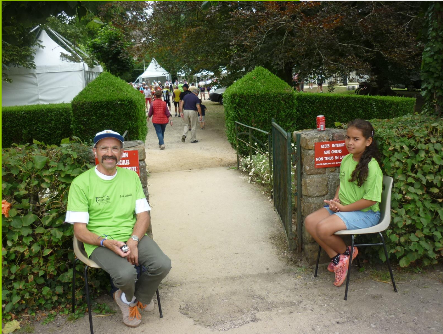
04 août 2017 Point Accueil Longny (2)