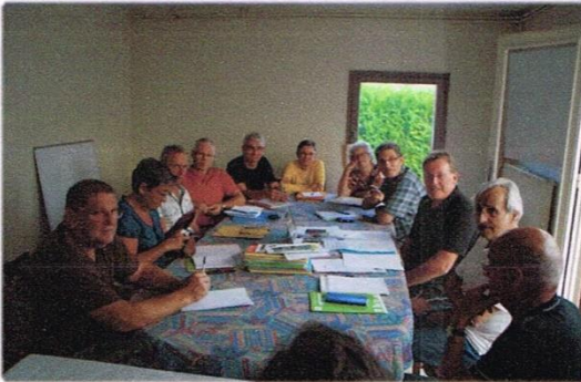
Réunion du COSFIC 23 Juin

En attendant la rentrée en septembre , rendez vous pour certains d'entre nous à SAINT POURCAIN SUR SIOULE