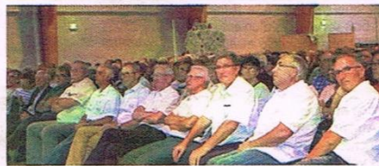
Ils étaient nombreux à avoir répondu à l'invitation des organisateurs de la Semaine fédérale dans le Perche.