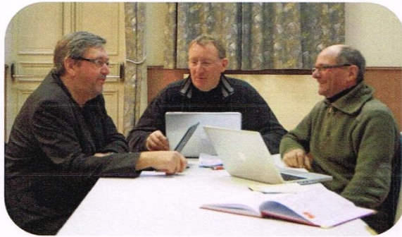
La grande AVENTURE peut démarrer avec la création du COSFIC*