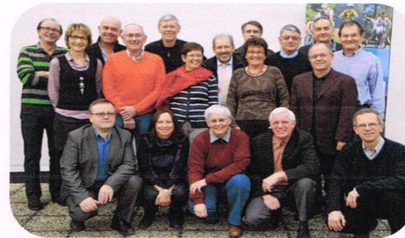
Le comité directeur de la FFCT, avant de débiter sa réunion ce samedi 18 janvier

"Sur ma proposition le comité directeur s'est prononcé à l'unanimité favorablement pour votre candidature à